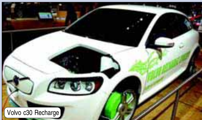
Volvo c30 Recharge