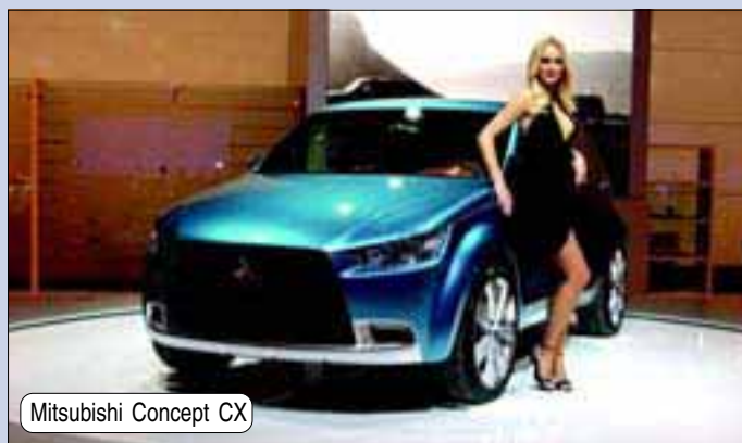
Mitsubishi Concept CX