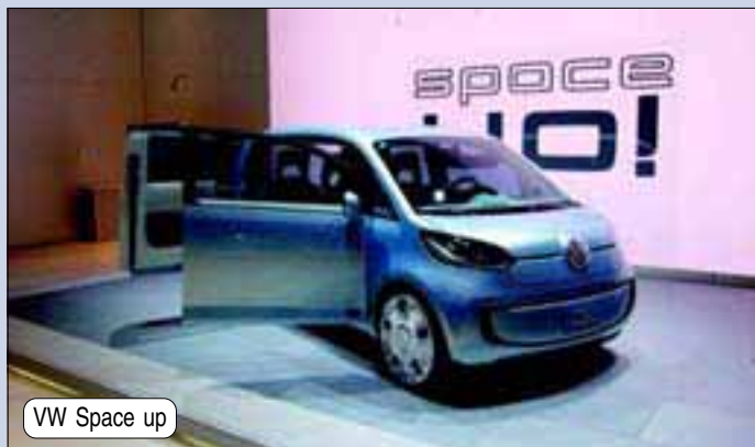
VW Space up

O C30 Recharge trata-se de um projecto da marca sueca onde promove os seus mais recentes desenvolvimentos no domínio dos híbridos. O conceito alia um motor de combustão de 1,6 litros, com quatro motores eléctricos colocados nas rodas. Prometendo uma vida útil das baterias capaz de durar tanto como o próprio veículo, a Volvo destaca a simplicidade da recarga. Basta uma tomada doméstica e não mais de três horas para uma carga completa. No modo totalmente eléctrico, autonomia anunciada é de 100 quilómetros.