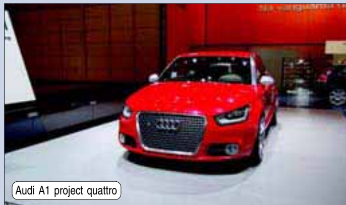
Audi A1 project quattro

Quanto ao Concept CX trata-se dum veículo equipado com motor "diesel limpo" de 1,8 litros, com turbo de geometria variável e 136 cv de potência, bem como "plásticos verdes", segundo refere a marca japonesa. Dispõe dum caixa de velocidades automática com dupla embraiagem e respeita as normas ambientais Euro 5.