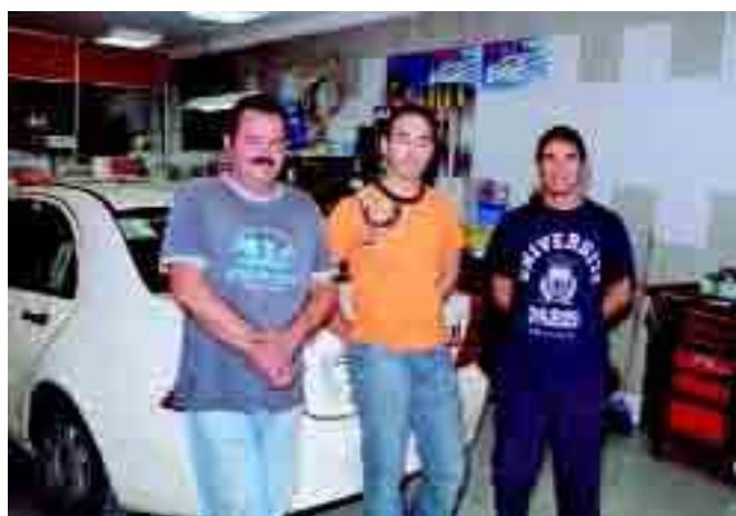
O pessoal da oficina

em funcionamento em pleno o sistema informático da Protaxisó, "a facturação da empresa já cresceu mais de 30%" - garante o seu Director Comercial.