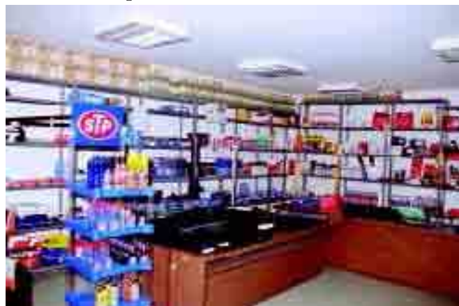
Loja de produtos e acessórios

Refira-se também que a Protaxisó fez todos os esforços possíveis para se certificar como entidade aferidora, o que só não se tornou uma realidade porque o Instituto Português da Qualidade não o permitiu. 📄