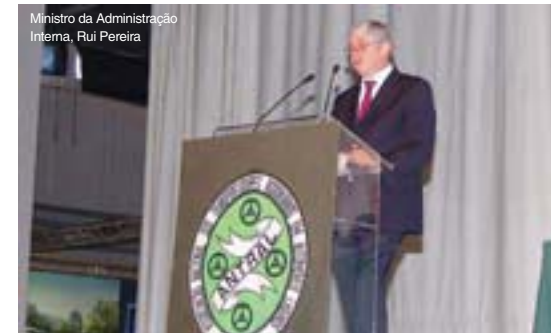
Ministro da Administração Interna, Rui Pereira

sistema de formação profissional e da obrigação do registo de horas de trabalho nos livretes individuais, o seguinte: “espero que haja uma resposta definitiva dentro de poucos dias. O IMTT tem também já concluída a sua proposta de regulamentação relativa ao transporte de crianças. O projecto de portaria relativo ao novo sistema de formação profissional prevê a redução significativa da carga horária, bem como a dispensa dos júris tripartidos para se fazerem os exames, e a substituição destes por exames multimédia, semelhantes aos que são utilizados para a obtenção das cartas de condução. Está em aberto também a possibilidade de utilizar os sistemas multimédia para facilitar os processos de aprendizagem” – garantindo ainda Crisóstomo Teixeira que o IMTT - “está na disposição de financiar o desenvolvimento de software, de modo a facilitar a tarefa dos Centros de Formação e dos profissionais”.