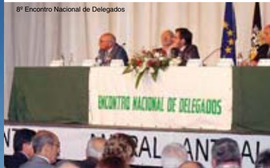
8º Encontro Nacional de Delegados

O ministro da Administração Interna reconhece que: “a ANTRAL tem tido um papel muito digno e credível na procura da resolução destes problemas. No relacionamento com a ANTRAL, ao longo destes anos, tenho-me percebido da enorme seriedade como procura resolver