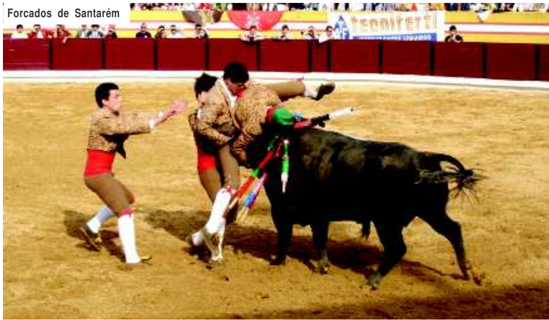
Forcados de Santarém

O escritor Almeida Garrett imortalizou Santarém na sua obra. Quem não se recorda da celebrada Joaninha das "Viagens na Minha Terra", nativa de Santarém, para o escritor a cidade: "é um livro de pedra, em que a mais interessante e mais poética das nossas crónicas está escrita. Rico de