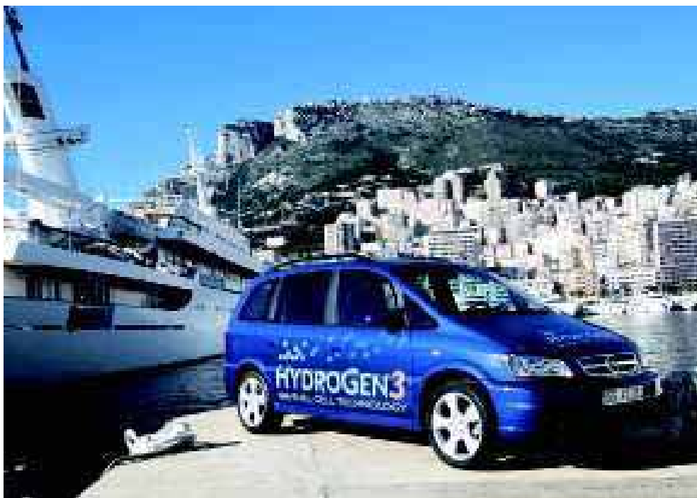
HydroGen 3, um protótipo baseado no Opel Zafira

dráulico de pistões, utilizando um novo conceito de isolamento que garante a fiabilidade do sistema e uma pureza elevada do hidrogénio.